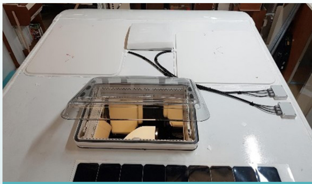
Antenne TNT installée sur le toit d'un camping-car