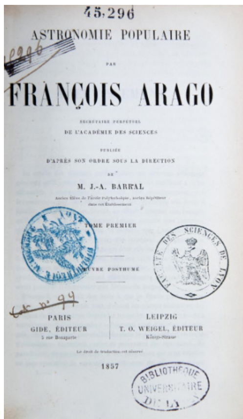
Figure 5 : «Astronomie populaire», ouvrage publié après la mort d'Arago.

La spécialisation d'Arago était celle d'un astronome, il logeait à l'observatoire et y resta toute sa vie durant. Il effectua des travaux novateurs dans l'observation du soleil avec son polariscope avec lequel il put déterminer la nature gazeuse du soleil. En effet il avait remarqué que les solides et les liquides incandescents émettaient une lumière dont la polarisation périphé-