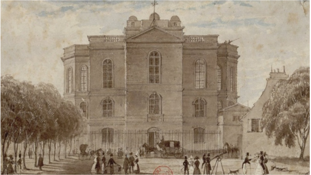
L'observatoire de Paris en 1829 - Source Gallica : dessin de Frederick Nash.