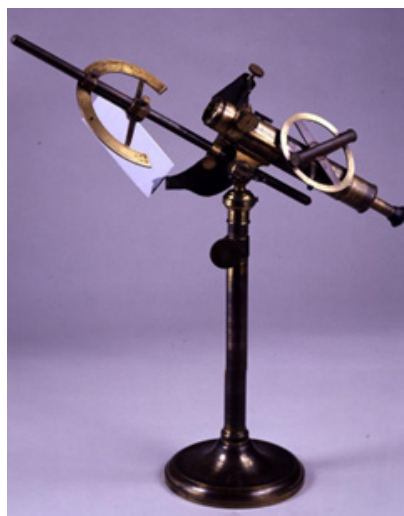
Figure 3 : Le polariscope d'Arago

La mesure de la vitesse de la lumière avait été effectuée par des méthodes astronomiques au XVIII ème siècle en particulier par James Bradley à partir du phénomène d'aberration des étoiles. Quand