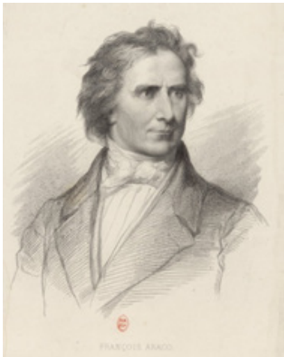
Figure 2 : Arago académicien.

●●● professeur. En plus du cours d'analyse que pratiquait Monge, Arago enseignait une discipline nouvelle qui appliquait le calcul des probabilités développé par Laplace à la démographie et à l'économie. En fait les statistiques provoquaient un réel engouement mais l'enseignement d'Arago restait assez élémentaire. Arago donnait aussi un cours de machine. La description et le fonctionnement de diverses machines accompagné des épures de géométrie descriptive donnaient aux élèves des rudiments de dessin industriel. L'expérience de ce cours donna à Arago l'occasion d'écrire une notice historique sur les machines à vapeur.