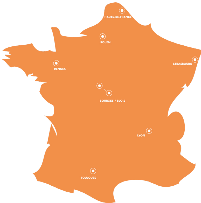
Figure 1 : Carte de France des implantations des différents INSA.

« Au total, le groupe INSA est un ensemble de plus de 22000 étudiants dont 15000 élèves ingénieurs, qui diplômé notamment chaque année 3600 ingénieurs, soit 10 % des ingénieurs diplômés en France, et 300 docteurs. »