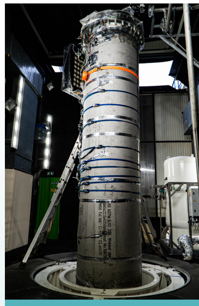
Figure 2 : Terminator premier démonstrateur pour HyPrSpace.

De nombreux projets de lancements de micro et mini lanceurs existent au niveau international (plus de 250 projets), dont 5 basés sur la propulsion hybride.