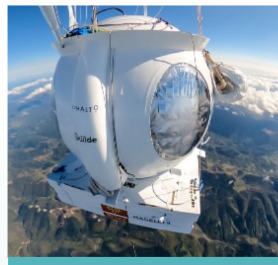
Figure 1 : La capsule Celeste.

Début 2021 : près de 1 million d'euros collectés (donateurs, investisseurs, organismes publics).