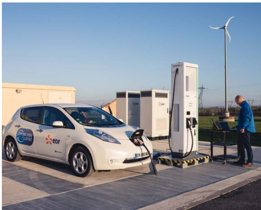
Station de charge de très forte puissance pour mobilité électrique – ©EDF - Adrien Daste/TOMA.

C'est un sujet sur lequel nous avons des échanges suivis avec nos collègues américains de l'EPRI ( Electric Power Research