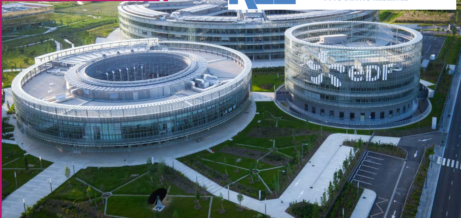
Site EDF Lab Paris-Saclay