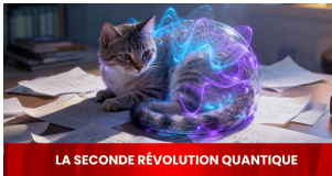
LA SECONDE RÉVOLUTION QUANTIQUE